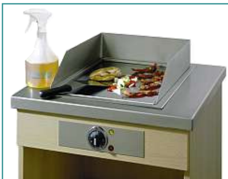
EINBAU-Beispiel in CNS-Tischplatte