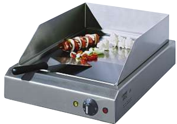
BG SLK 40 A