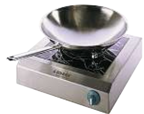
BI SLK 10 A mit WOK-Pfanne, CNS, 3 KugelfüÙe

Indux-Generatoren sind europaweit geprüft.