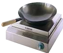
BI SLK 10 A mit WOK-Aufsatz, und WOK-Pfanne