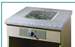
EINBAU-Beispiel in Küchen- Arbeitsplatte