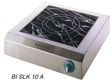
BI SLK 10 A